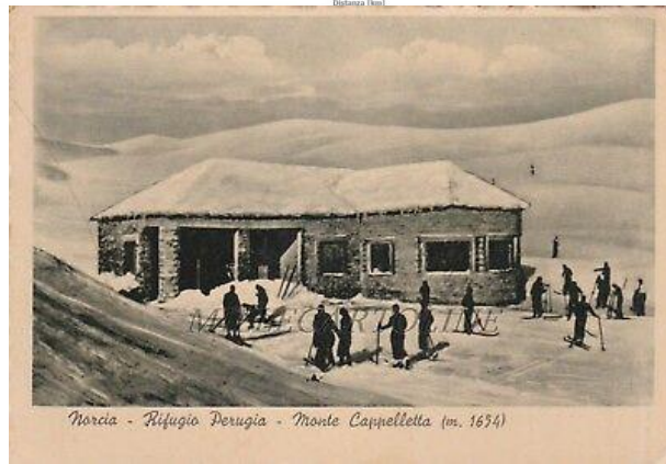
Norcia - Rifugio Perugia - Monte Cappelletta (m. 1654)