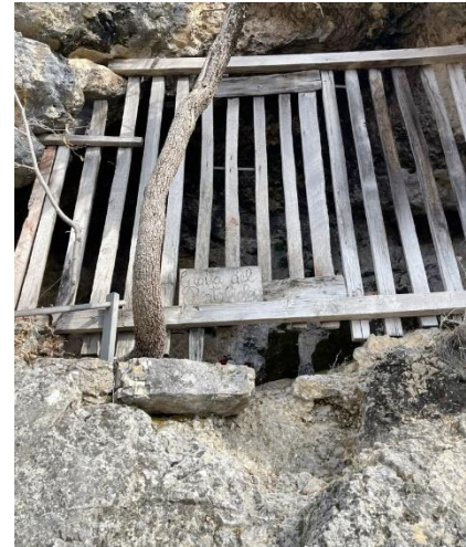
La grotta del Beato Giolo